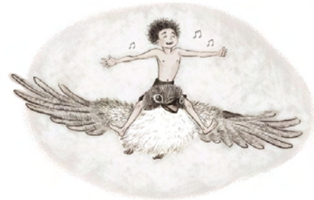
Ein Roman für Kinder ab 6 Jahre

Auf Henriette Musemanns Fensterbank steht ein kleines Haus. Darin wohnt Milo, der kleine Mus. Wenn er mit seinem Klangkescher nicht gerade auf der Jagd nach Tönen ist, bewirft er Henris Familie mit Musenküssen – bis alle zusammen auf dem Küchentisch tanzen.